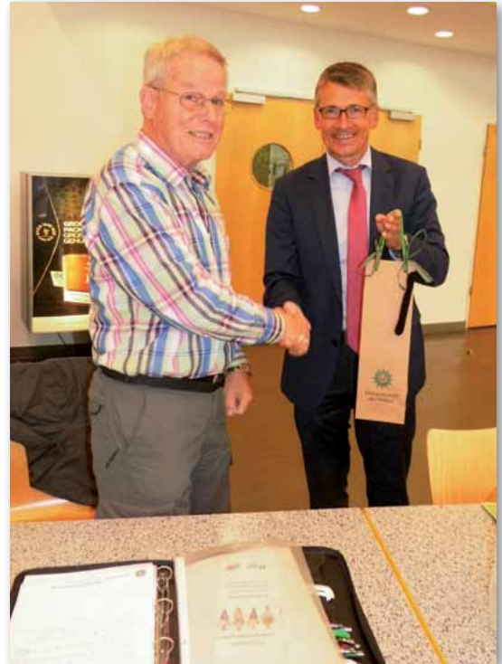
Vielen Dank für den interessanten Vortrag